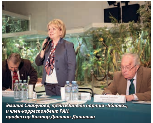
Эмилия Слабунова, председатель партии «Яблоко», и член-корреспондент РАН, профессор Виктор Данилов-Данильян

С разных концов России приезжают его последователи в любимое Яблоковым Петрушово, чтобы поработать в яблоневом саду, и увозят во все регионы страны саженцы, которые он вырастил из яблоневых семечек.